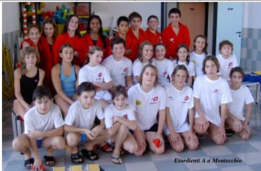
Esordienti A a Montecchio