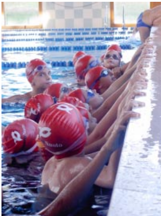
Riscaldamento Esordienti B a Montecchio

“ BRAVISSIMI CONTINUATE SEMPRE CON QUESTO ENTUSIASMO ”.