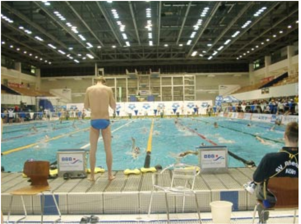
La piscina di Berlino